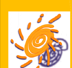
tavola 1b 1:5.000